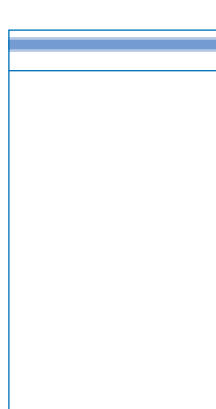
Briefhülle (Hochformat) mit Klappe (rechteckig), Falznut und Adhäsionsverschluss