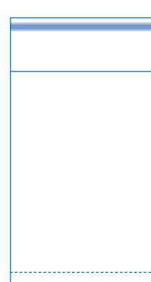
Bodenfaltenbeutel mit Klappe (rechteckig) und Adhäsionsverschluss