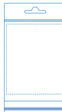
Headerbeutel mit Euroloch, 2 oder 3 Kammern, Klappe unten mit Adhäsionsverschluss