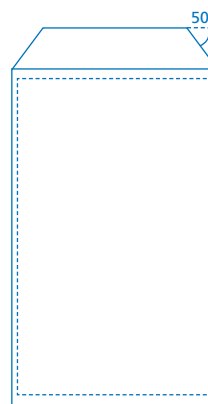
Klappenbeutel mit angeschrägten Ecken und 2 oder 3 Kammern