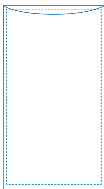
Flachbeutel mit 2 oder 3 Kammern